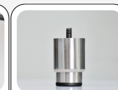
Pieds en acier inoxydable