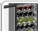
Étagères à vin disponibles en option