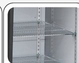
Étagères réglables en chrome